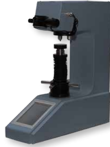
МЕТОЛАБ 422 / МЕТОЛАБ 452