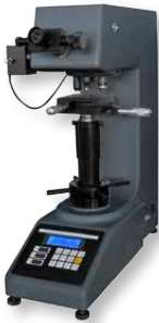
МЕТОЛАБ 421 / МЕТОЛАБ 451