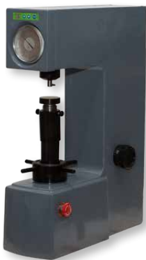
МЕТОЛАБ 101 /МЕТОЛАБ 301