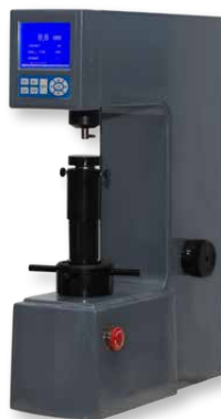
МЕТОЛАБ 102/ МЕТОЛАБ 202